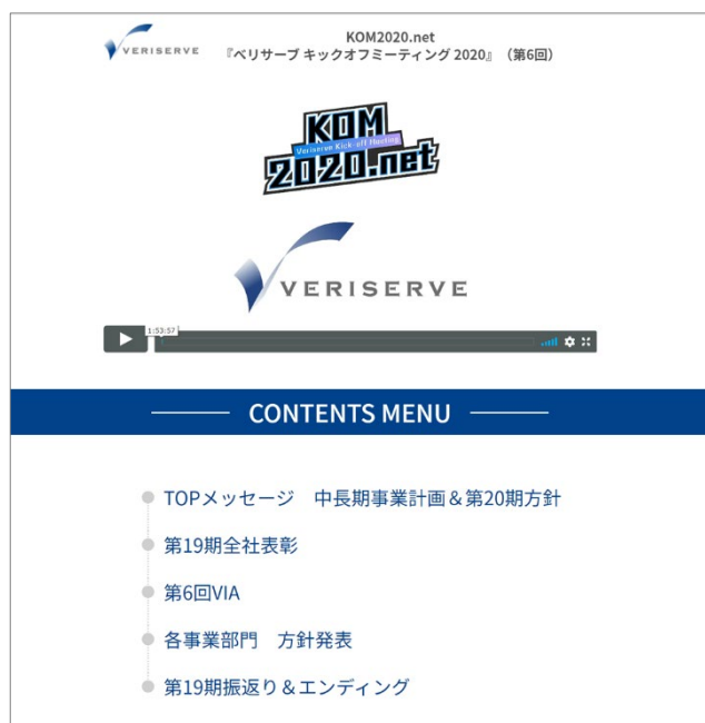
社員総会動画配信